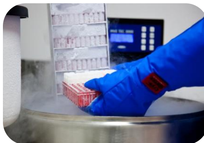
آزمون های مهارت