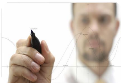
مشاوره و آموزش