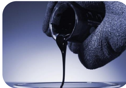
نفت و پتروشیمی